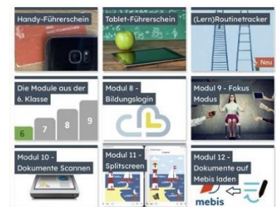
Beispiel Jahrgangsstufe 7

Das DSdZ-Team arbeitet im Moment daran, durch systematische Medienkompetenzbildung gute Voraussetzungen für gelingendes Lernen zu schaffen. Dafür wurden verbindliche Module für die iPad-Jahrgangsstufen 6 bis 9 entwickelt. Einen Einblick in die Module für die Jahrgangsstufe Ihres Kindes finden Sie im Mebis-Kurs „Tablet-Klassen am WHG“.