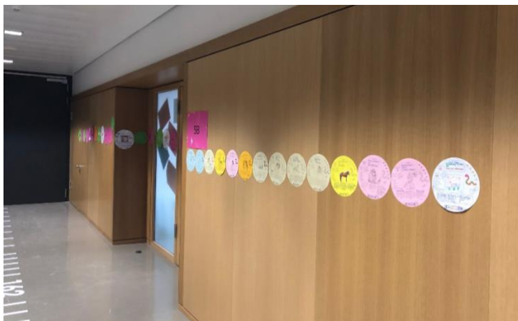
Bücherwurm Werner junior im Gang der fünften Klassen

Auch die Bücherwürmer Werner junior und senior sind im neuen Schuljahr angekommen und schlängeln sich weiter durch unser Schulhaus. Werner junior hat dabei kräftig vorgelegt und nun schon den Fünftklassgang im ersten Stock fast gänzlich durchquert. Doch das reicht dem kleinen Nimmersatt natürlich nicht und so freut er sich über zahlreiches neues Futter in Form von ausgefüllten Büchersteckbriefen . Die Weihnachtsferien eignen sich dazu besonders gut. Lesestoff gibt es in der Schulbibliothek, bei der Onleihe der Garching Stadtbücherei oder weiteren öffentlichen Bibliotheken. Doch auch Werner senior soll nicht verhungern und zumindest ein bisschen näher an den Schülerwurm herankommen. Deshalb sind auch alle Eltern und Lehrkräfte herzlich eingeladen, sich wieder an unserer Leseaktion zu beteiligen . Die Vorlage gibt es digital im Elternportal oder in Papierform vor dem Sekretariat und in den Klassenbüchern. Ausgefüllte Steckbriefe bitte digital an werner.wurm@werner-heisenberg.de schicken oder ins Fach von „Werner Wurm“ im Lehrerzimmer abgeben.