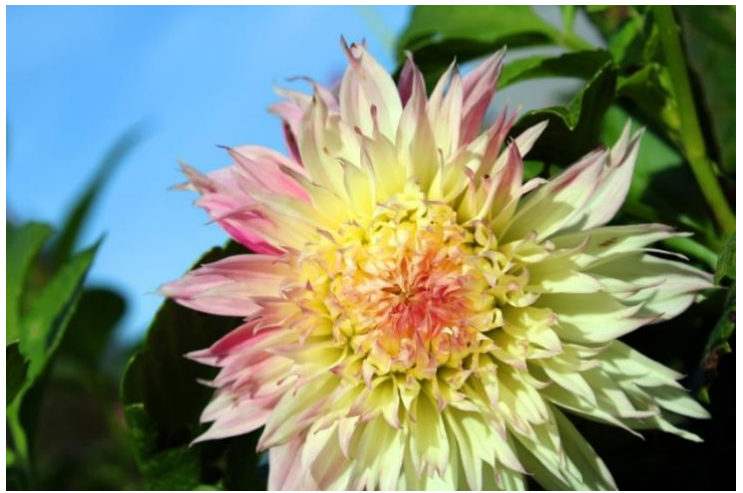
Yvette Bauer, 6d, Wahlkurs Fotografie