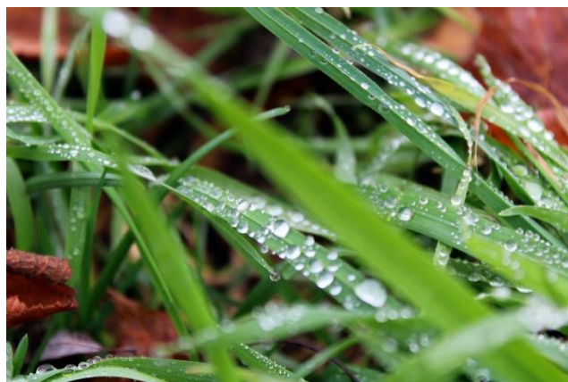
Felicia Cono, 5a, Wahlkurs Fotografie